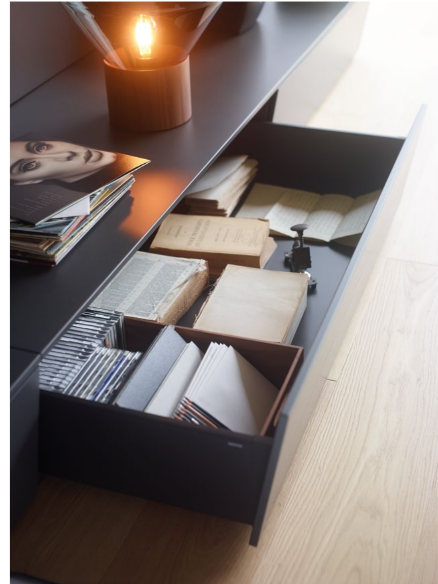
Los cajones zócalo sacan partido a la zona más próxima al suelo, ofreciendo gran capacidad de almacenamiento. Estos elementos cuentan con un sistema mecánico de apertura asistida, que facilita el acceso a los interiores. Su frontal, inclinado hacia el interior, evita molestos tropiezos al moverse cerca del mueble.